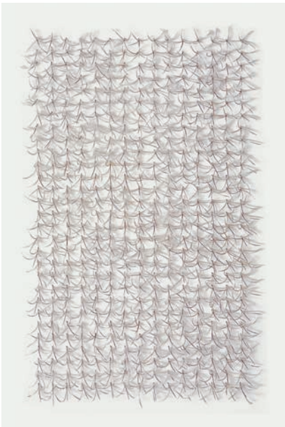
ANGELA M. FLAIG Weidenröschen 29 x 15 | 2009 | Weidenröschensamen auf Tischlerplatte | 150 x 90 cm © VG Bild-Kunst, Bonn 2018