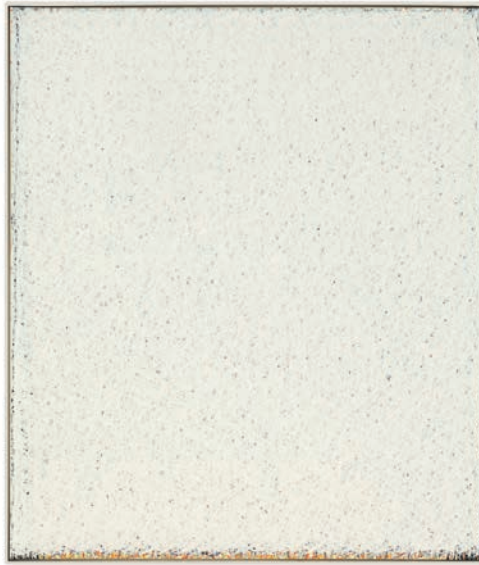
ROMUALD HENGSTLER 23/76 | 1976 | Öl auf Leinwand | 145 x 124,5 cm Sammlung Landkreis Rottweil

Zur Ausstellung erscheint ein Katalogbuch.