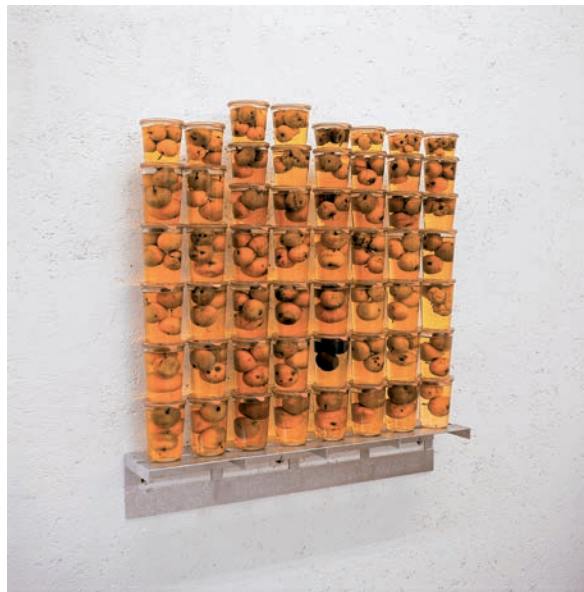
DANIEL BRÄG Klarapfel | 1998 | Verzinktes Eisen, Glas, Äpfel, Birnen ca. 100 x 80 x 15 cm | Im Besitz des Künstlers © VG Bild-Kunst, Bonn 2018