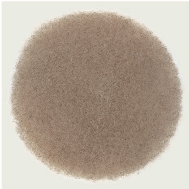
ANGELA M. FLAIG Waldrebenkreisfläche | 2014 | Waldrebensamen | 150 x 150 cm © VG Bild-Kunst, Bonn 2018