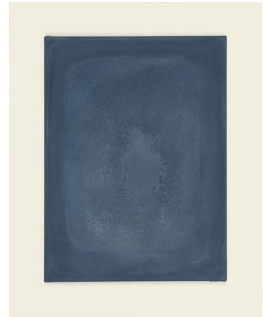
GOTTHARD GRAUBNER Ohne Titel | 1962 | Öl auf Leinwand | 40 x 30 x 5 cm Sammlung Gerhard Breinlinger, Konstanz © VG Bild-Kunst, Bonn 2018