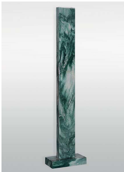
Heinz Mack , Ohne Titel, 2005, Quarzit (Norwegen), 170,5 x 40 x 20 cm, im Besitz des Künstlers