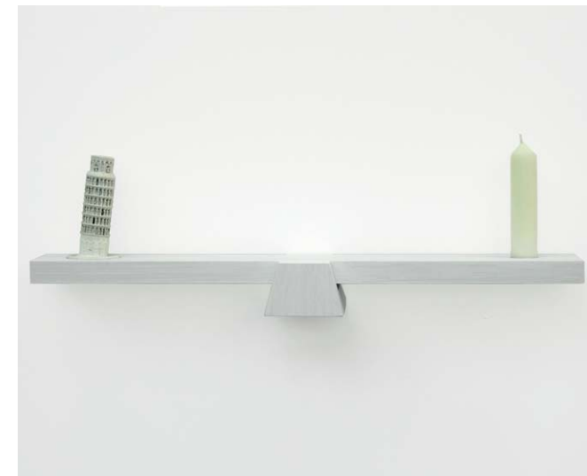
Timm Ulrichs , Versuchsanordnung zur Wiederaufrichtung des Schiefen Turms von Pisa, 1987/2001, Zweiteilige Holzvippe, 6,7 x 70 x 16 cm, mit Kunststoff-Nachbildung des Schiefen Turms von Pisa und weißer Kerze, 14,5 x 0 3,5 cm, im Besitz des Künstlers