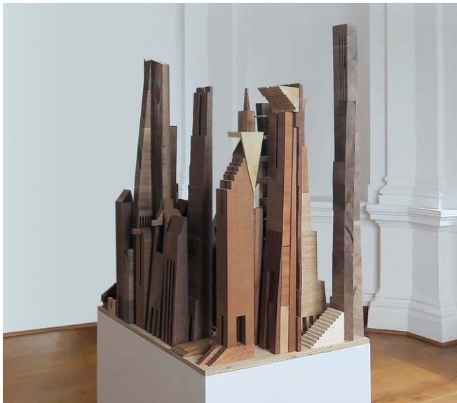
Claus Bury , Hochhauslandschaft, 2010, verschiedene Holzarten und Kupferlegierungen, 61 x 81 x 83 cm, im Besitz des Künstlers