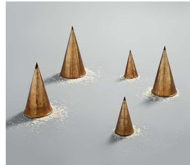
Wolfgang Laib , Die Reismahlzeiten, 1986, fünf Messingkegel und Reis, je Durchmesser/Höhe 15,4/28 cm, 13,6/25,2 cm, 13,6/25 cm, 8,8/16,5 cm, 8,5/15,5 cm Sammlung Landesbank Baden-Württemberg